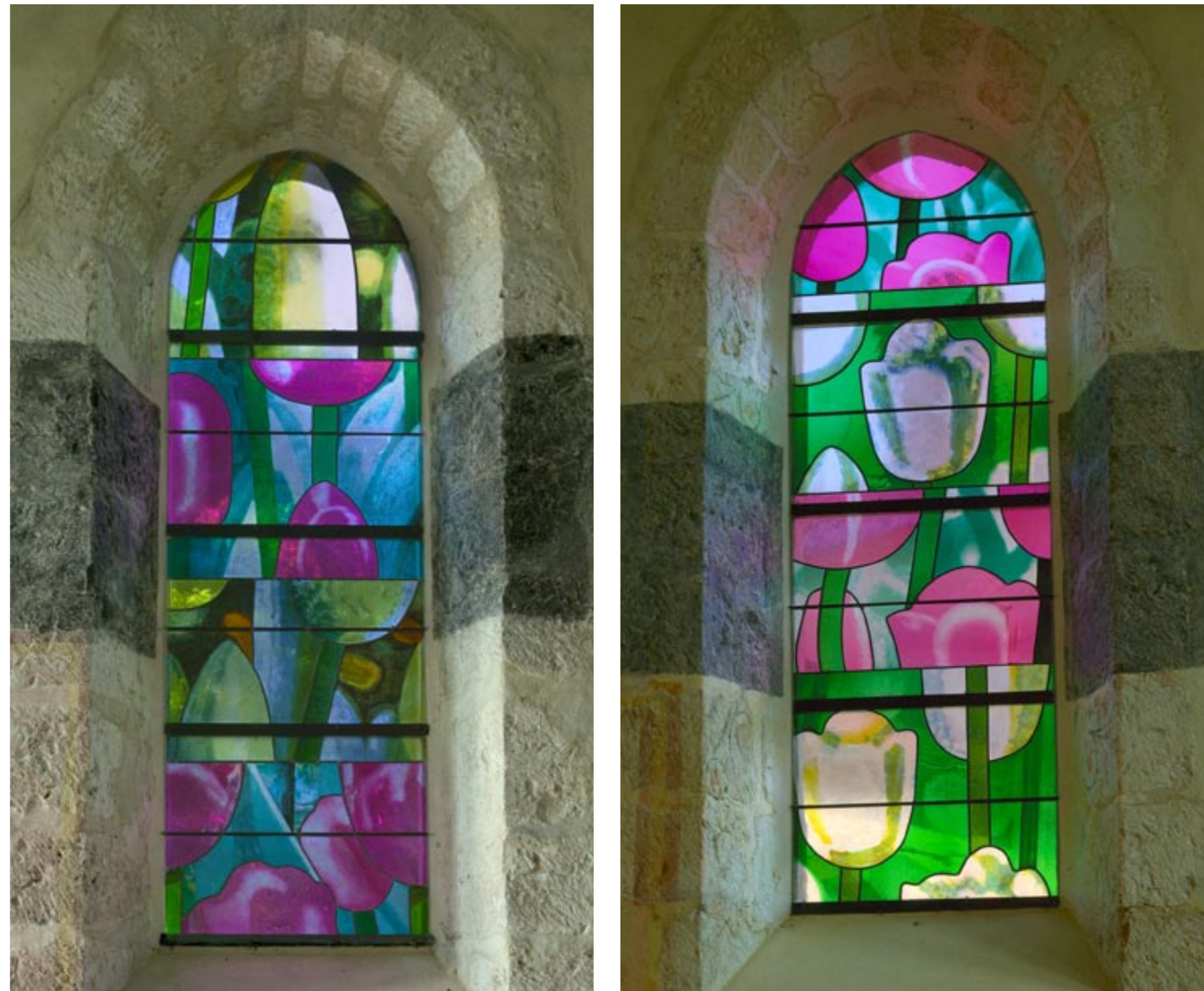
De gauche à droite, l'Arbre de Jessé, vitrail latéral sud et vitrail latéral nord