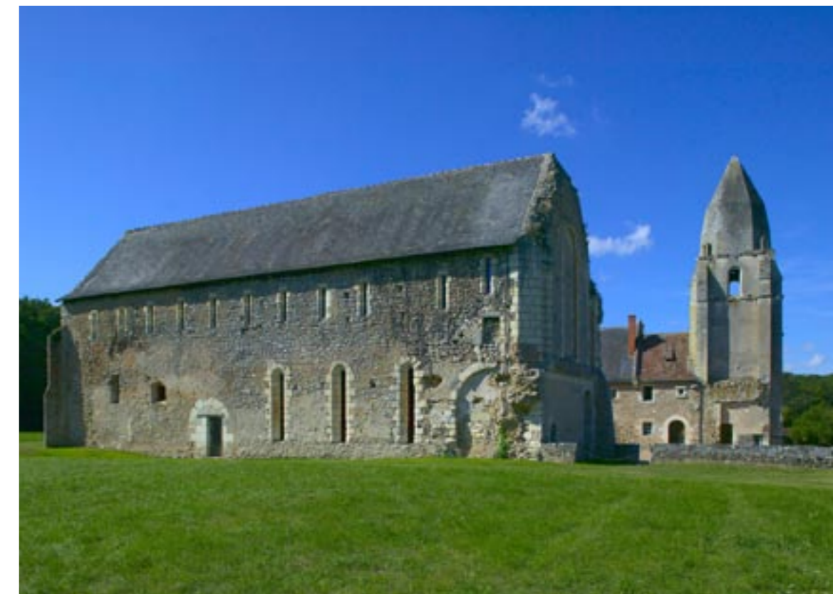
Prieuré Saint-Jean-du-Grais. Bâtiment des moines, salle capitulaire, à l'étage, dortoir.