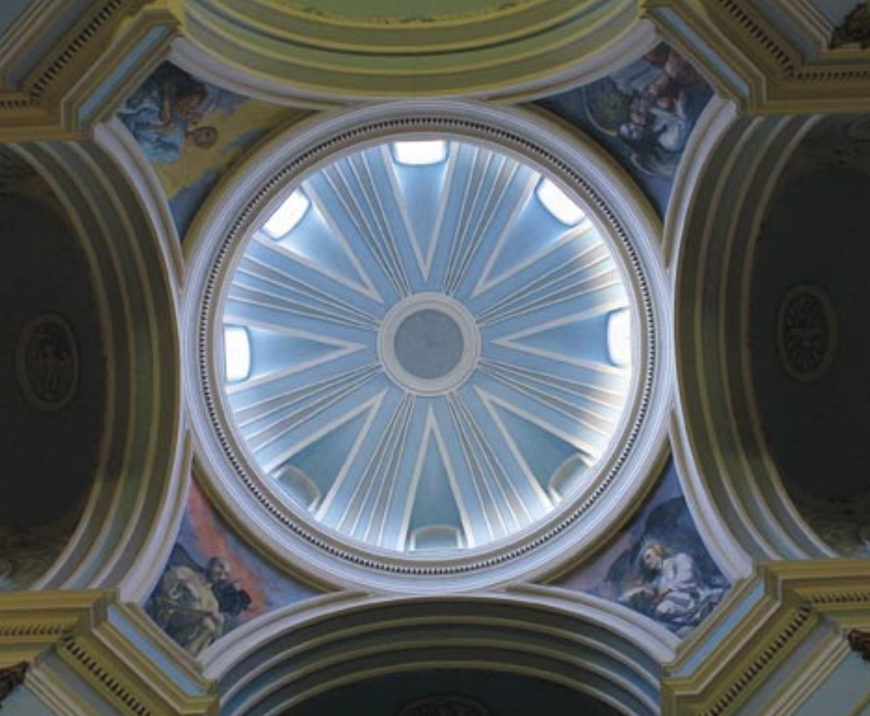
Église abbatiale, Marcilla, Espagne. Coupole.