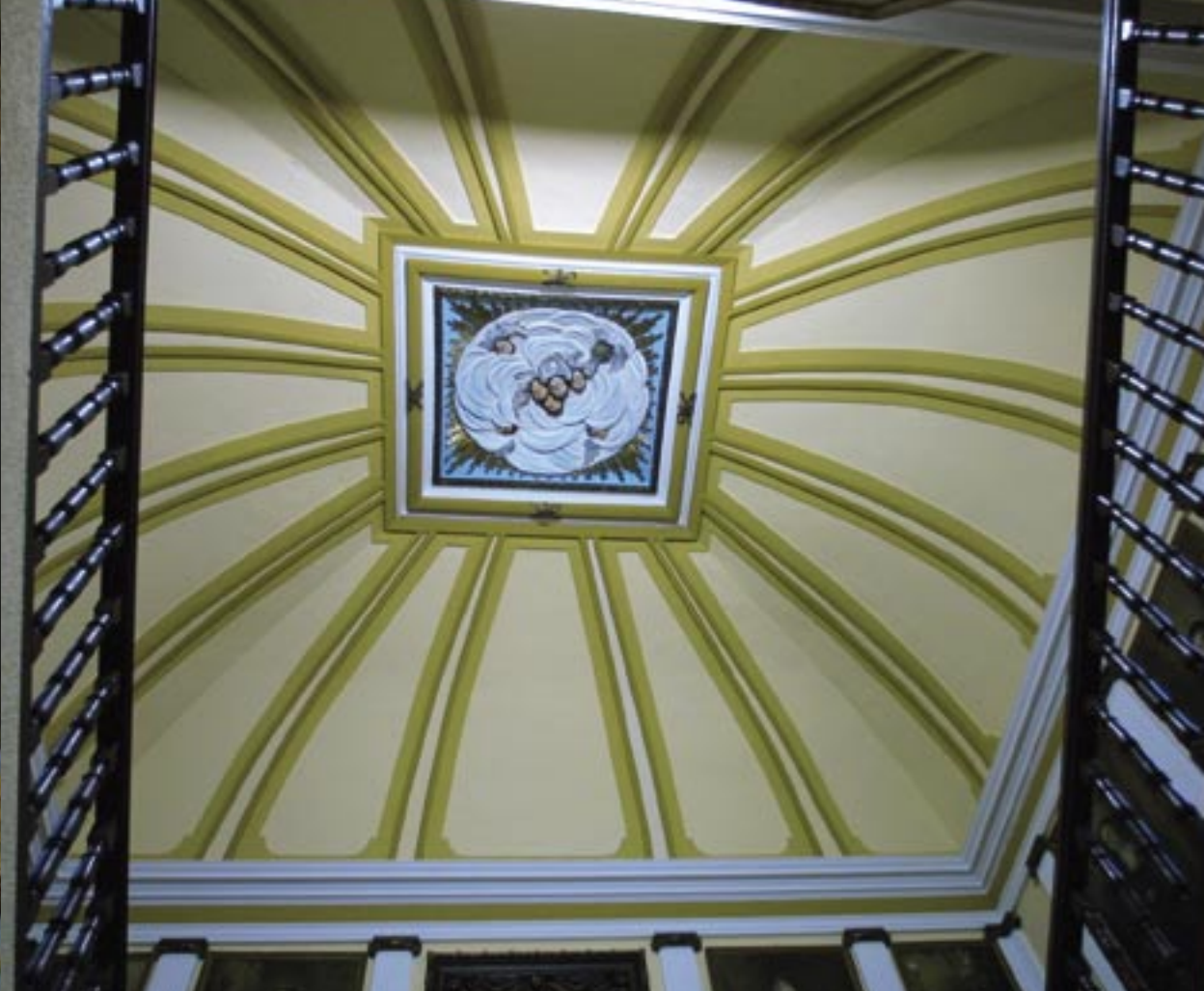
Escalier d'honneur, bâtiment des moines, abbaye de Marcilla, Espagne. Coupole.