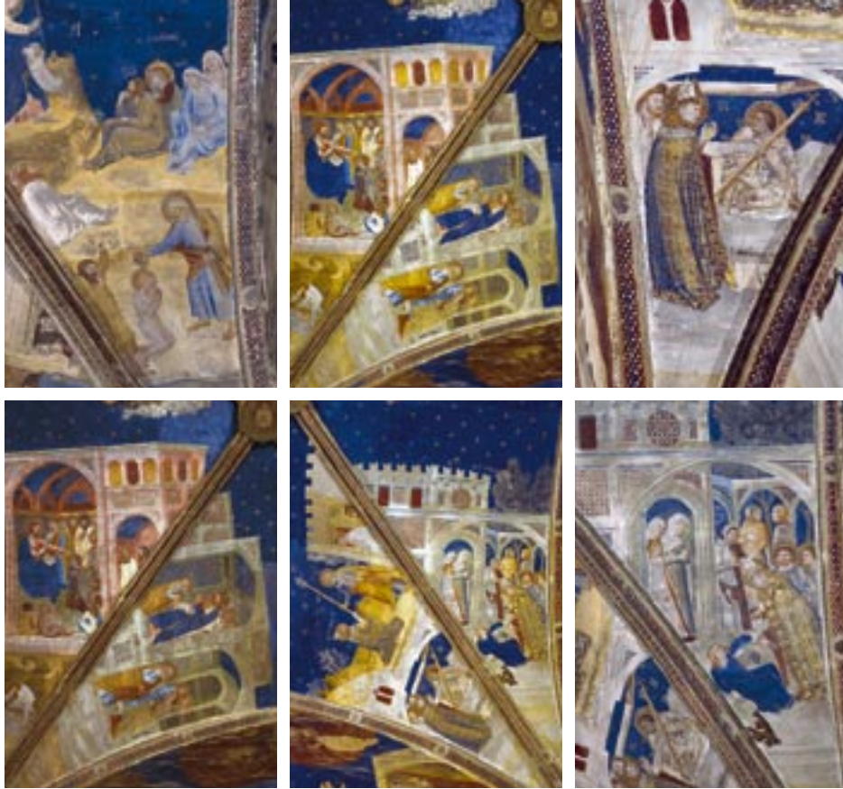
Palais des Papes, Chapelle Saint-Martial, Avignon, Vaucluse, France. Les voûtes de la chapelle ont été décorées par Matteo Giovanetti à la demande du Pape Clément VI au XIV e siècle. Elles représentent des scènes de la vie de saint Martial.